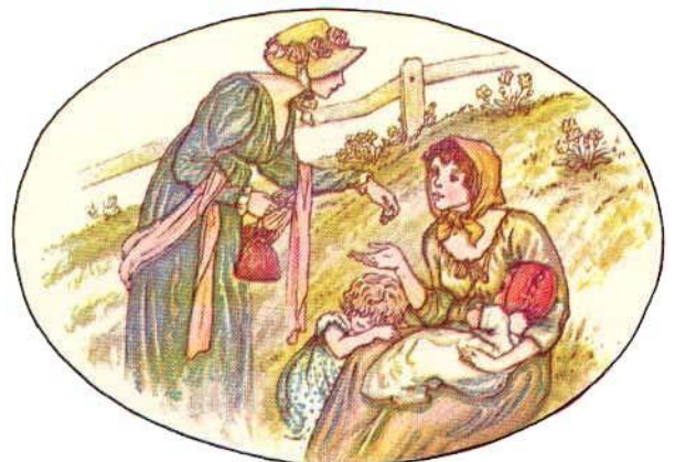
Kate Greenaway's Language of Flowers Wild grape – Charity

Boldoot bracht rond 1920 nog een reeks van 72 plaatjes uit, met de titel Mooi Zwitserland , bestaande uit 6 series van 12 plaatjes. Daarop is geen album vermeld.