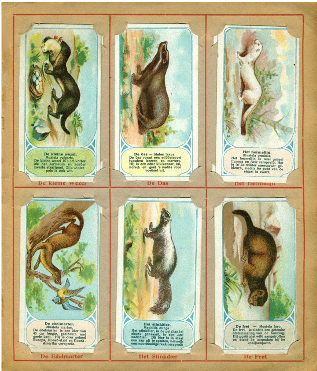
De eerste pagina.