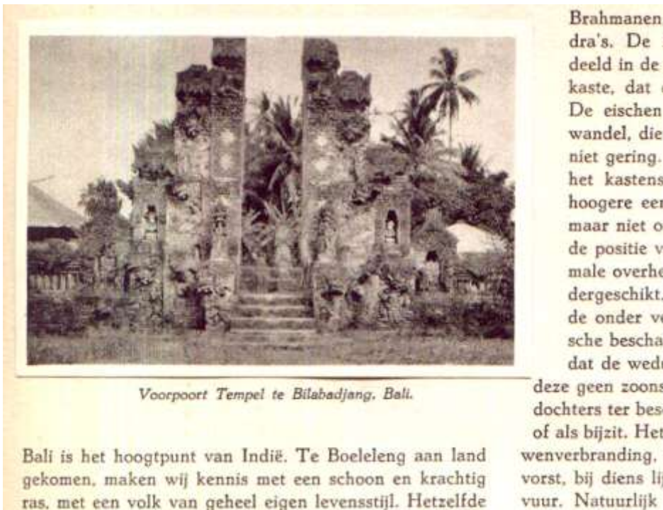
Voorpoort Tempel te Bilabadjang, Bali.

De tekst is in twee kolommen gezet, zoals voor de oorlog bijna alleen bij enkele meer documentaire albumseries werd aangetroffen, bijvoorbeeld de Indië albums van Droste. Een eigenaardigheid in het zetsel is, dat de plaatjes breder zijn dan de tekstkolom zodat de liggende plaatjes in de naastliggende tekstkolom steken. De tekst in de naastliggende kolom springt dus in. Het inspringen boven een plaatje of uitspringen onder een plaatje gebeurt echter niet in één keer; over de hele hoogte van de marge boven of onder het plaatje is slechts ingesprongen met de breedte van het plaatje, en alleen langs het plaatje wordt een extra witmarge gegeven. Dit geldt m.m. ook voor de staande plaatjes in de kolom zelf. Dit heeft het vreemde effect dat één hoek van een plaatje steeds aan een hoek van de boven of onderliggende tekst raakt. In het derde album is deze eigenaardigheid weggelaten.