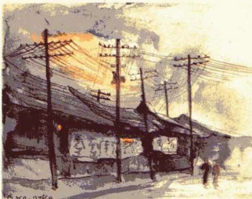
Straatje bij avond. Zulk een net van telegraaf- en telefoondraden is kenmerkend voor Japan, waar zeer veel gebruik wordt gemaakt van electriciteit.