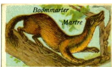
Een plaatje op ware grootte.

De selectie van de dieren is volstrekt willekeurig, het konijn naast de krokodil, en de eidereend naast de antilope.