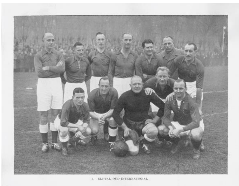
Elftal van oud-internationals

De eerste elftalfoto is van een elftal oud-internationals, gevolgd door 2. het Nederlands elftal, 3. Zuid-Nederlands elftal, 4. Heerenveen, 5. N.O.A.D., 6. Blauw-Wit, 7. Ajax, 8. Enschedese boys, 9. V.S.V. en 10. S.V.V.