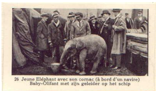
26 Jeune Eléphant avec son cornac (à bord d'un navire) Baby-Olifant met zijn geleider op het schip

Na de beurskrach van augustus 1929 begon de jarenlange recessie, waardoor veel bedrijven een rem moesten zetten op geschenk-artikelen. Waarschijnlijk is het album door het reclamebureau dat het voor Koopmans opgezet heeft in 1931 opnieuw op de markt gebracht, met hetzelfde zetsel van de tekstpagina's, maar met een andere omslag en "normaal" ingebonden. Alleen de inleiding is opnieuw gezet, waarbij de oorspronkelijke datum is weggelaten en enkele zetfouten zijn gemaakt, en de eindversiering op de laatste pagina is vervangen door een "moderne". De titelpagina is vervangen door een neutrale pagina met veel open ruimte waarin reclame van een bedrijf gedrukt kon worden. Op de voorkant is ruimte gelaten waarop de bedrijfsnaam gedrukt kon worden of een reclamestrook geplakt kon worden. Ook kon men de achterzijde van de plaatjes laten bedrukken met eigen reclame.