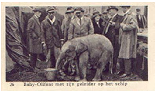
26 Baby-Olifant met zijn geleider op het schip

Het album is in 1930 heruitgegeven in België door de firma Comanin, warenhuis in "kristal, porselein, pronk- en huishoudartikels" in Antwerpen, met de titel "Album Onze Dierentuin". De plaatjes werden hiervoor van een tweetalige titelopdruk voorzien. Het zijn geen kopieën van de Nederlandse plaatjes, maar nieuwe drukken van de originele negatieven zoals te zien is aan de verschillende uitsneden op de hiernaast afgebeelde plaatjes.