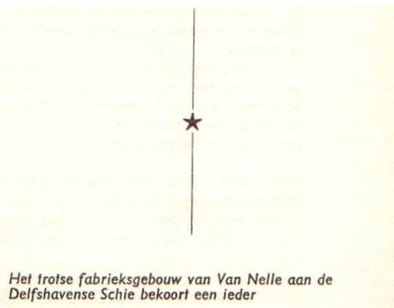
Het trotse fabrieksgebouw van Van Nelle aan de Delfshavense Schie bekoort een ieder