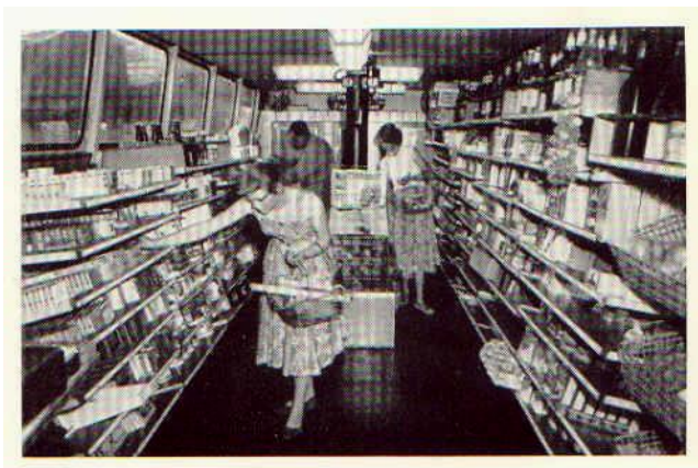
Een varende zelfbedieningswinkel, met frigidaire De eerste in Europa

"Kooplustige vrouwen beweren, dat men op het water aanmerkelijk rustiger kan winkelen dan aan de wal."