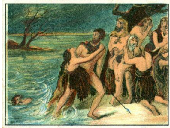
No. 1 Ongeveer 110 jaren voor onze jaartelling, had er een reusachtige overstroming plaats, de Kimbrische vloed genoemd, waardoor geheel Nederland onder water liep.