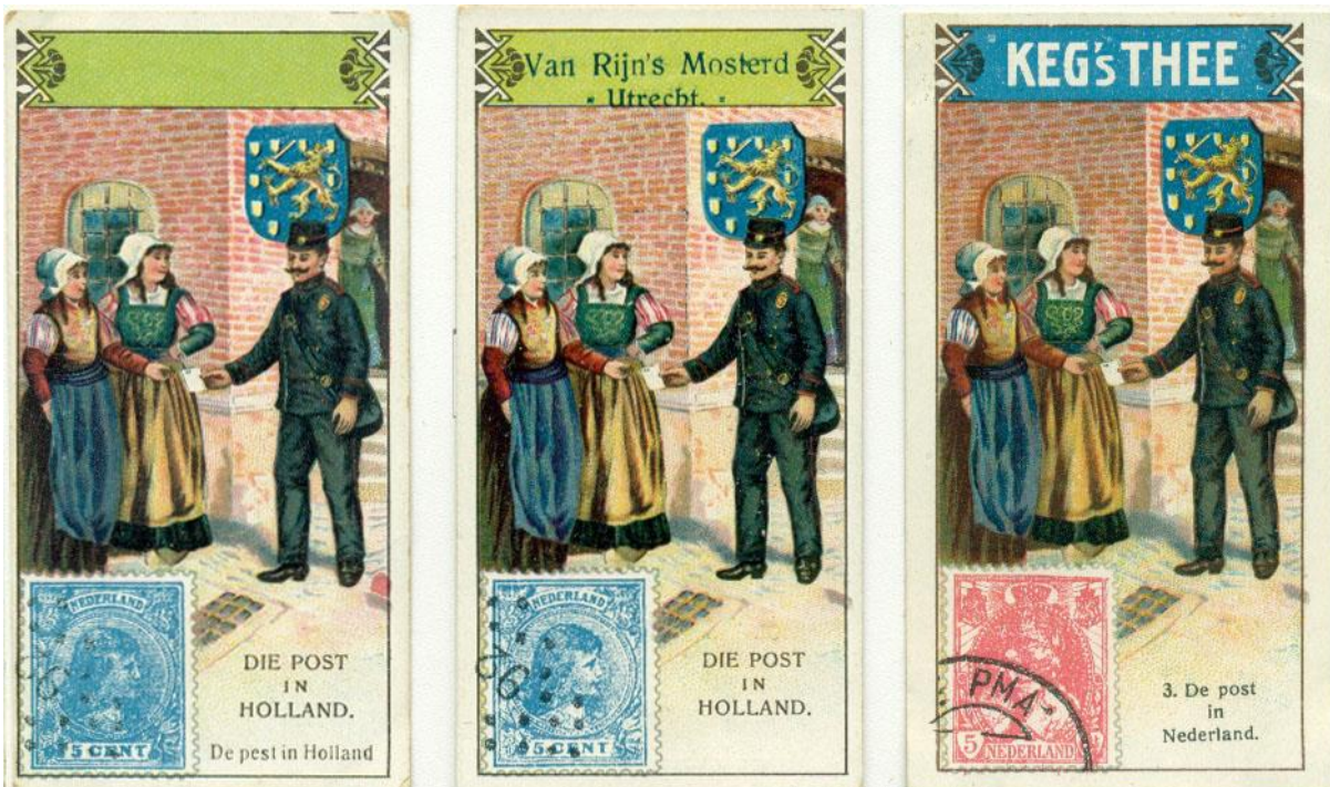
De post in Holland. Links de versie van Modjo, in het midden van Van Rijn en rechts de aangepaste van Keg.

Andere bedrijven hebben ook de series De Post en Landen uitgebracht, aangevuld met de firmanaam op de voorkant. Van Rijn's mosterd bijvoorbeeld heeft een dun vierkant albumpje uitgebracht voor 48 plaatjes, met series van 48 plaatjes van de post, landen, dieren en diverse andere.