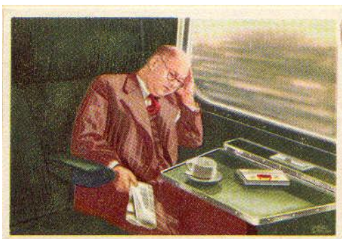
No. 47 Slapende reiziger

De ongesigeneerde geschilderde plaatjes van 46 x 66 mm zijn doorlopend genummerd 1 – 120.