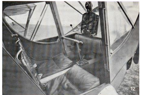
12. Precies een auto! Het interieur van een modern sportvliegtuig.