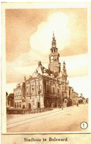
Stadhuis te Bolsward

De ANWB heeft in de dertiger jaren twee klassieke albums laten maken, waarvan de eerste werd uitgegeven door HAKA en de tweede door de ANWB zelf. De plaatjes werden verspreid door detailhandelaren. Het eerste is bedoeld voor de kampeerder, het tweede is gericht op verkeerseducatie van jongeren in de middelbare school leeftijd en volwassenen. Dit nieuwe album richt zich zowel op reizen en trekken als op verkeerseducatie, en wel voor kinderen van de lagere school. Het is gemaakt voor Van der Plaats, met medewerking van de ANWB die informatie verstrekke en het voorwoord verzorgde. In de krantenadvertenties die de nadruk legden op de gevaren van het verkeer bevat het album "leerzame lessen van de Amsterdamse Verkeerspolitie".