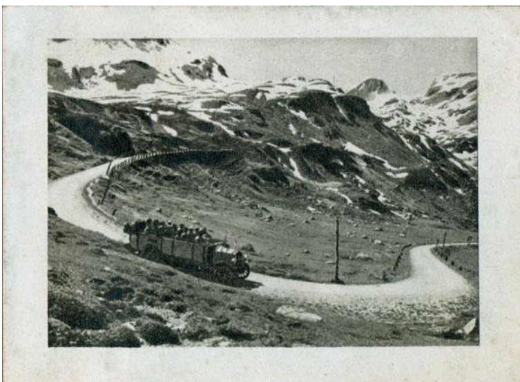
Plaatje 36. Julier-pas met postauto.

Een echt tijdsbeeld geven alleen de enkele plaatjes met spoor- of bergbanen en de "postauto's".