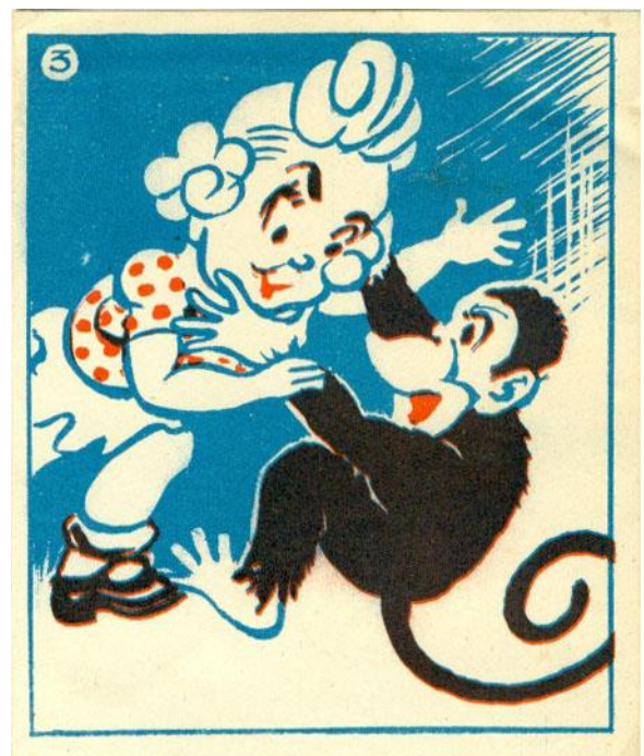
Thea ontmoet een oude bekende, het aapje Joko uit het eerste verhaal.

Het album eindigt met "Tot weerziens", dit is echter het laatste wat van de firma Schilte is vernomen.