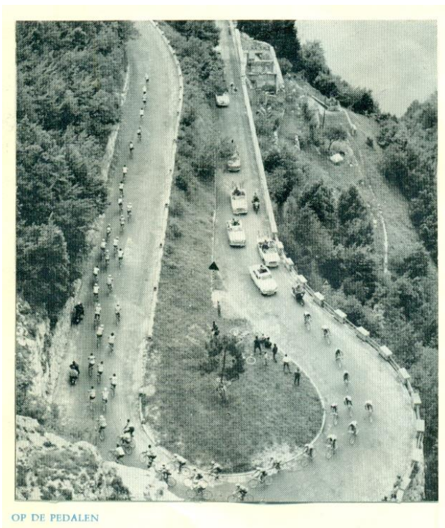
OP DE PEDALEN