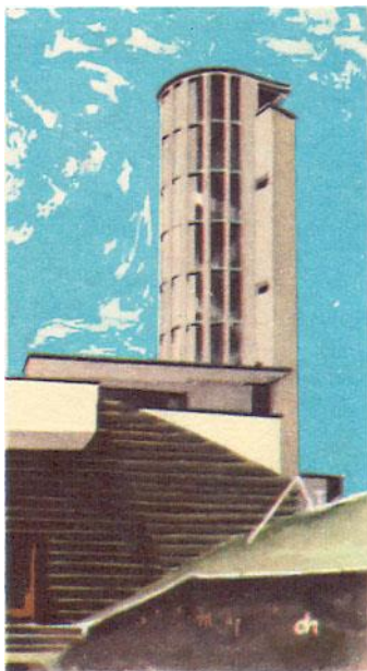
Monument op de Aisluitdijk van de bekende architect Dudok. Op deze plaats werd het laatste gat in de Aisluitdijk, „de Vlieter“, gedicht.

De plaatjes zijn deels gesigineerd ch en deels EB, zie de lijst op de volgende pagina's. De plaatjes zijn zeer verschillend van afmetingen en uitvoering. Er zijn kleine plaatjes van dik papier van "zwartjesformaat" (40 x 60 mm) die kennelijk los uitgegeven zijn, met de tekst op de achterkant (zie rechtsonder). De meeste plaatjes zijn echter uit diverse verpakkingen geknipt, van dik crèmekleurig papier of stijver grijs karton met afmetingen van de afbeeldingen variërend van 45 tot 50 mm breed en van 82 tot 90 mm lang, waarbij de tekst onder de afbeelding is gedrukt (zie hiernaast).