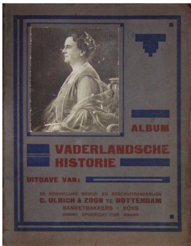
Het reclamealbum Vaderlandsche Historie Deel IV . (zie ook UMI).