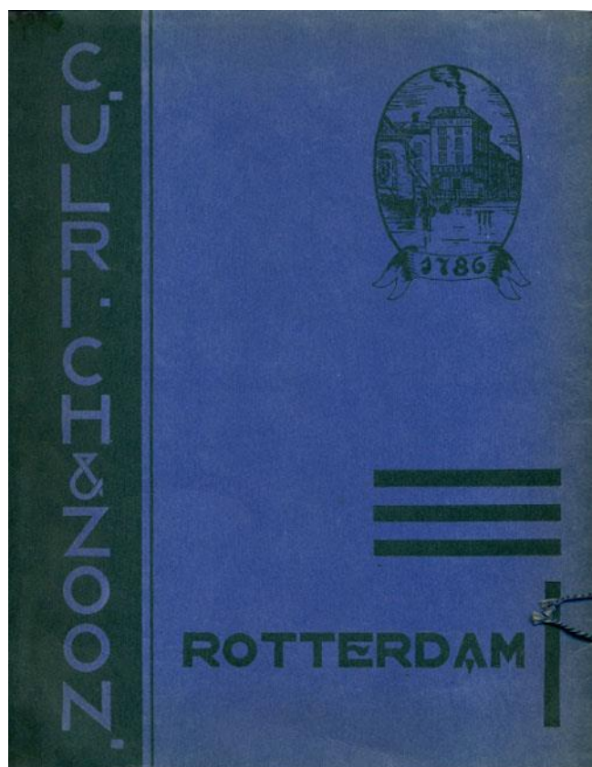
De achterkant van het album "Uit de stad van Erasmus".