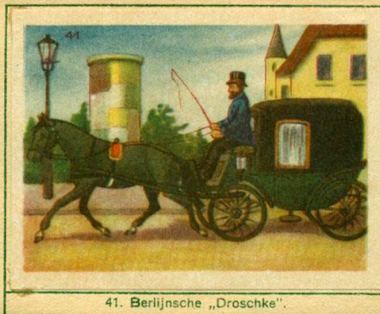
41. Berlijnsche „Droschke“.

Plaat 33 toont ons de Europeesche vrachtwagen, een eenigszins lichtere verscheidenheid van de zware boerenwagen, die wij allen van onze wegen kennen. Door een overdek worden de te vervoeren goederen tegen regen en zon beschut.